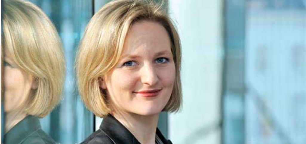
ДР ФРАНЦИСКА БРАНТНЕР, ЧЛАНИЦА ЕВРОПСКОГ ПАРЛАМЕНТА